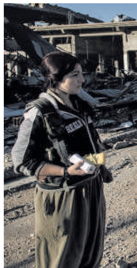
Vrouwelijke PKK-strijders in Sinjar,

Alles wat de PYD/YPD en de PKK doen, is gericht op het behoud van de autonomie van Rojave en op het veroveren van het gebied tussen de Eufraat en het kanton Afrin in noordwest-Syrië. Daarmee zullen ze een aaneengesloten grondgebied hebben, een eigen Republiek Koerdistan. Het zal ze niets kosten om tegen Nederland te zeggen dat ze daarvan afzien. Ze gaan er toch voor: linksom of