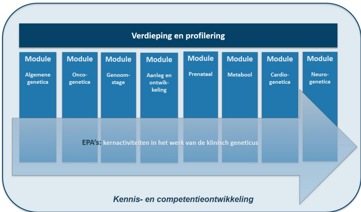
Figuur 1: verhouding bouwstenen opleiding klinische genetica

De modules betreffen medisch inhoudelijke aandachtsgebieden in de klinische genetica. De thema-overstijgende EPA's geven kernactiviteiten in het beroep van de klinisch geneticus weer. Kennis wordt zowel in modules, als bij EPA's en in het cursorisch onderwijs ontwikkeld. Binnen de opleiding is ruimte voor verdieping en profilering ten aanzien van specifieke onderwerpen.